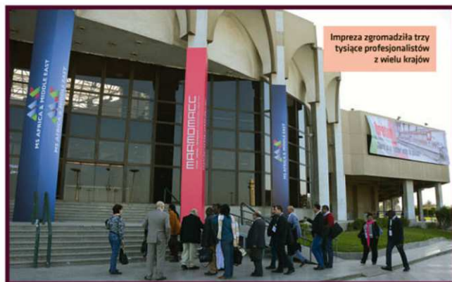
Impreza zgromadziła trzy tysiące profesjonalistów z wielu krajów

Veronafiery Press Service Tel: +39 045 829 82 42 – 82 85 E-mail: pressoffice@veronafiery.it Twitter: @pressVRfiery